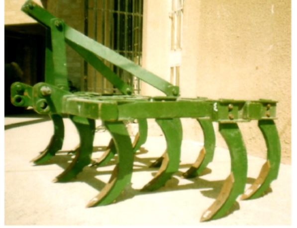
الشكل ( 3 ) : المحراث بالقصبات المنحرفة إلى الأمام.